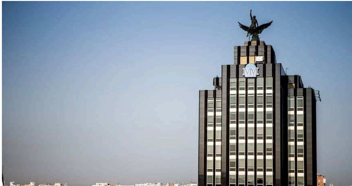
Sede social de Mutua en el Paseo de la Castellana 33

Cuando alguien decide caminar por el Paseo de Recoletos de Madrid, y levanta la vista, lo más probable es que se encuentre con carteles de alguna entidad aseguradora: Mapfre, Catalana Occidente, Helvetia, Generali... Si alarga el recorrido, hacia el Paseo de la Castellana, es Mutua Madrileña la que se hace más visible. Hablamos de la particular milla de oro del sector seguros, un sector que carga su zurrón con un importante número de posesiones inmobiliarias.