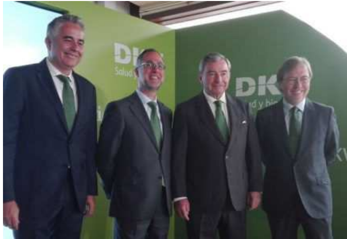
DKV anhela un pacto de caballeros para salir del hospital de Denia

Por lo que respecta a Generali , los edificios más antiguos en el eje Castellana-Recoletos están en la calle Serrano 1 y en la calle Independencia 4. Ambos construidos en 1900, el primero tiene 3.300 metros cuadrados destinados a oficinas y 1.100 metros cuadrados para retailers . El segundo tiene 3.360 metros cuadrados, de los que 1.900 corresponden a superficie residencial y, el resto, para retailers .