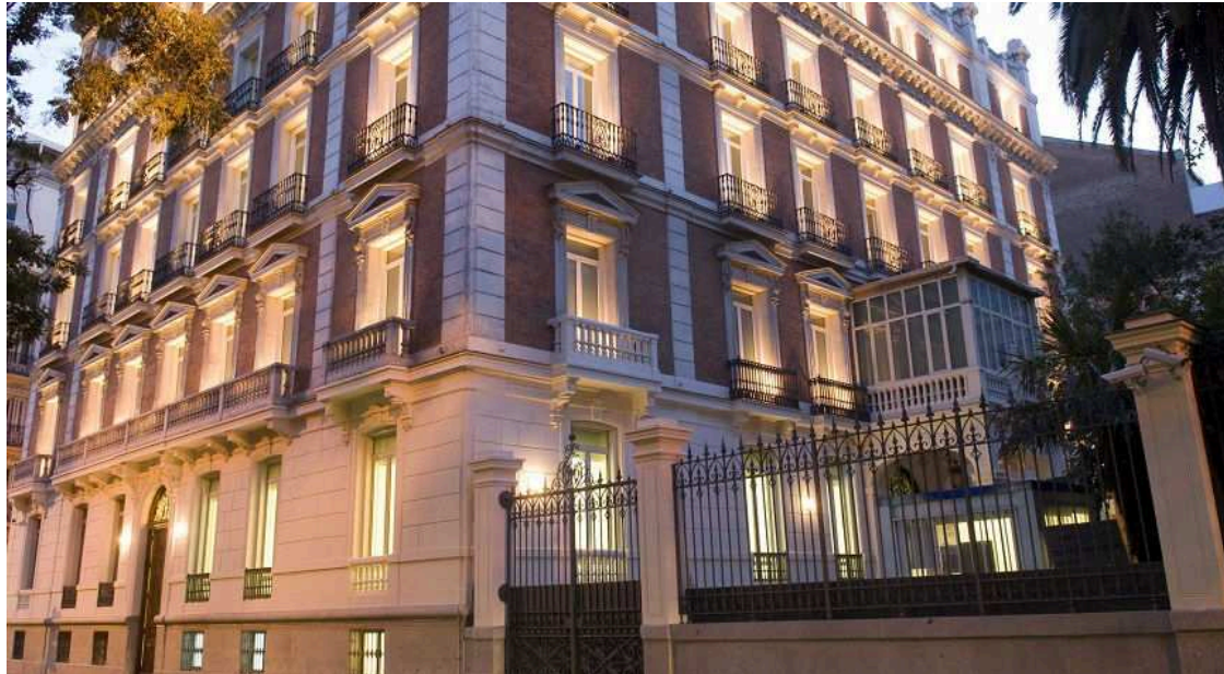
Uno de los edificios de Mapfre en el Paseo de Recoletos 23

Algunos de ellos son palacetes de principios del siglo XX, como los situados en el Paseo de Recoletos 23, y 25. El primero de ellos, con 6.200 metros cuadrados de oficinas y salas de exposiciones, fue adquirido por Mapfre en los años 80, y hoy en la sede social y sala de exposiciones de la Fundación Mapfre. El segundo, con 5.800 metros cuadrados, es la sede de Mapfre Re, y fue adquirido por 41,2 millones. Su estrategia inmobiliaria se basa en la desinversión de inmuebles que generan plusvalías, y en la búsqueda de otros con una buena localización, ya arrendados, y que les aporten rentabilidad inmediata y plusvalía futura.