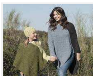
Prendas de la Colección Aymara 2011

Hoy el Centro Comercial Moda Shopping de Madrid recibe a un grupo de artesanas de la Coordinadora Mujeres Aymaras de Juli-Puno (CMA) de Perú que en conjunto a un equipo de diseñadoras españolas del Centro Superior de Diseño y Moda de la Universidad Politécnica de Madrid, presentarán la colección Moda Aymara 2011.